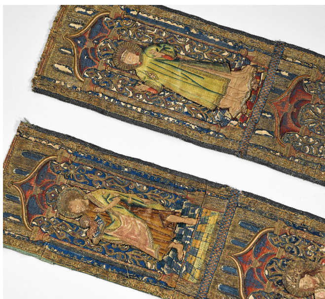
◀ Deux bandes d'orfrois en soie polychrome brodée. Décor de six saints personnages sous des niches architecturées. Travail français de la fin du 15 e siècle. Dim. 93 x 13 et 94 x 13 cm. Lot estimé 2 000 à 3 000 €.