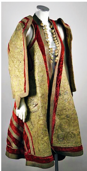
▲ Manteau d'apparat en velours cramoisi brodé en tresse métallique or et argent, dessinant des arabesques. Thrace (entre la Bulgarie, la Grèce et la Turquie). 19 e siècle. Estimé 800 à 1 300 €.

Jeudi 26 septembre à 14 h 30, à l'hôtel des ventes, 70 rue Vendôme (6 e arr.). Expositions le 25, de 10 h à 12 h, et de 14 h à 18 h ; et le 26, de 9 h à 12 h. De Baecque & Associés. Tél. 04 72 16 29 44.