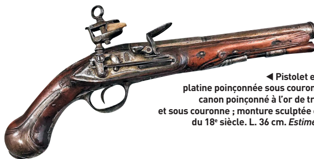
◀ Pistolet espagnol à silex, platine poinçonnée sous couronne sur 3 lignes, canon poinçonné à l'or de trois fleurs de lys et sous couronne ; monture sculptée en noyer. Milieu du 18 e siècle. L. 36 cm. Estimé 1 000 à 1 200 €.

Samedi 21 septembre à 14 h 15, à l'hôtel des ventes, 8 rue du docteur Joseph Audic. Expositions le 20, de 9 h à 12 h et de 14 h à 18 h ; et le 21, de 9 h à 11 h. Ruellan Tél. 02 97 47 26 32.