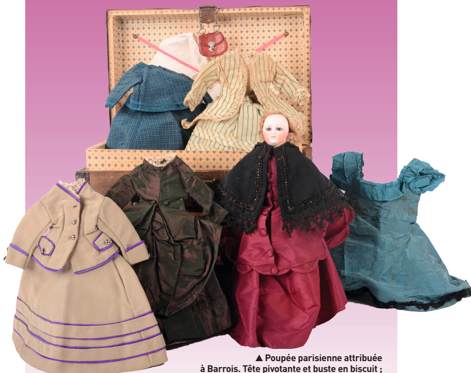
▲ Poupée parisienne attribuée à Barrois. Tête pivotante et buste en biscuit ; yeux bleus, oreilles percées, corps en peau, fessier à gousset, doigts détachés. Sa malle comprend 5 ensembles en soie ou coton en très bel état, cinq chapeaux, ses sous-vêtements, bottines en cuir à talon et un sac à main en crôte de cuir. H. 29 cm. Le lot estimé 3 000 à 5 000 €.

Samedi 28 septembre à 10 h et à 14 h, à l'hôtel des ventes, 7 rue Collin d'Harleville. Expositions le 27, de 14 h à 17 h, et le 28, de 9 h à 12 h. Galerie de Chartres. Tél. 02 37 88 28 28.