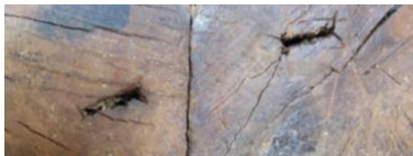
Cette trace d'étau au centre de la base, de part et d'autre du joint de collage, montre que les deux blocs de bois étaient déjà collés lorsqu'ils ont été placés dans l'étau.

Ces entailles mesurent toutes respectivement 1,5 cm de longueur et l'espace qui les sépare deux à deux est identique : 3,5 cm.