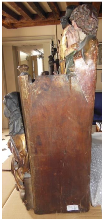
Côté senestre de B, simplement ébauché et presque non polychromé. (Vue générale et détail de la partie supérieure, où la polychromie est réservée aux surfaces accessibles au regard).