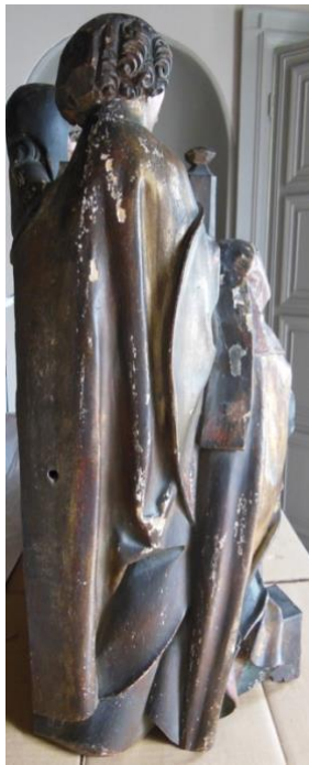
Côté dextre de A, entièrement sculpté et polychromé.

Pour plus de clarté, nous proposons d'appeler A la moitié sénestre du relief, et B la moitié dextre.