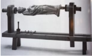
Reconstitution d'un établi de sculpteur lors d'une exposition consacrée au sculpteur Weckmann.

L'œuvre présente des traces d'outils nettes, caractéristiques des ateliers germaniques. Sous la base, se distinguent les trois doubles entailles de l'étau dans lequel le bloc de bois était maintenu lors de la taille (flèches bleues). Dans les ateliers de sculpture, les blocs de bois étaient en effet travaillés dans des étaux qui les maintenaient à l'horizontale.