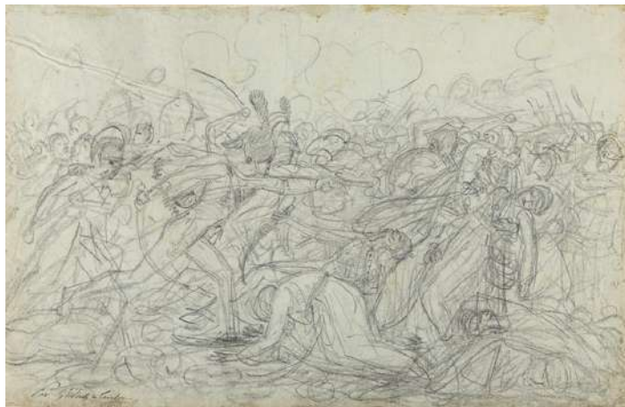
Anne Louis GIRODET TRIOSON (1767 - 1824) Étude pour La Révolte du Caire, 25 x 38 cm Adjugé 72 000 €