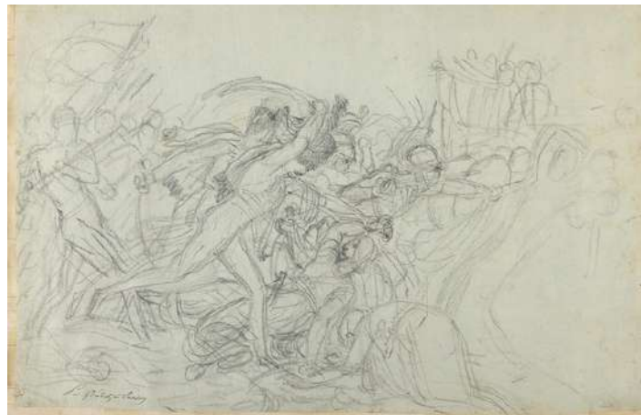
Anne Louis GIRODET TRIOSON (1767 - 1824) Étude pour La Révolte du Caire, 24,5 x 36,5 cm Adjugé 55 000 €

Ces deux dessins d'A.L GIRODET TRIOSON (1767-1824) ont été découverts au cours d'une journée d'expertises.